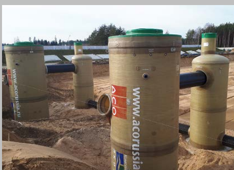
Индустриальный парк "Великий камень" "Оборудование для очистки поверхностного стока в составе ЛОС накопительного типа с самым большим в мире безбетонным аккумулирующим резервуаром АСО StormBrixx, Минск, Республика Беларусь